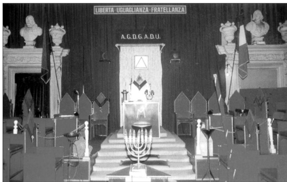
Nelle foto: sopra, una loggia massonica; sotto, un grembiule usato durante i riti massonici e un tempio massonico; a sinistra, il compasso, simbolo della massoneria.

Al pensiero debole, che porta a una sorta di pseudoreligiosità caratterizzata